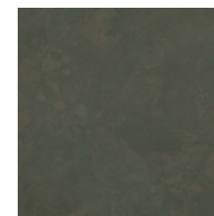
BLACK 銅 斑紋黒染色

※印刷の都合上、掲載されている色や模様等は実物と異なる場合があります。ご了承ください。