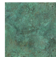
GREEN 真鍮 斑紋ガス青銅色