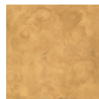
YELLOW 真鍮 斑紋黄華色