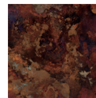
COPPER RED 銅 斑紋孔雀色