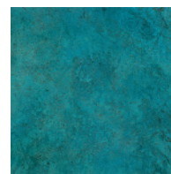
BLUE 銅 斑紋ガス青銅色