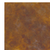
ANTIQU BRASS 真鍮 硫化色