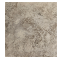
ANTIQU SILVER 真鍮 斑紋純銀色