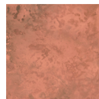
COPPER PINK 銅 斑紋荒し色