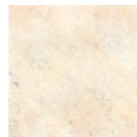
SILVER 銅 斑紋純銀色