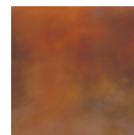
AMBER 銅 硫化色